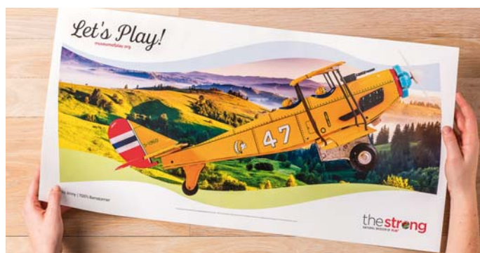
Печать сверхдлинных листов — максимальный размер бумаги 330 x 660 мм

Все это способствует повышению рентабельности, увеличению прибыли и расширяет возможности для стратегического развития. Инвестиция всего в одну машину станет залогом вашего успеха в будущем.